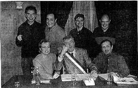
« Un conseil "très" municipal », une pièce de café-théâtre rythmée, drôle et bien ancrée dans son époque.

Ce « Conseil municipal » est plutôt un conseil d'ivresses, un cocktail explosif aux ingrédients savamment dosés : un maire au sourire cornas-